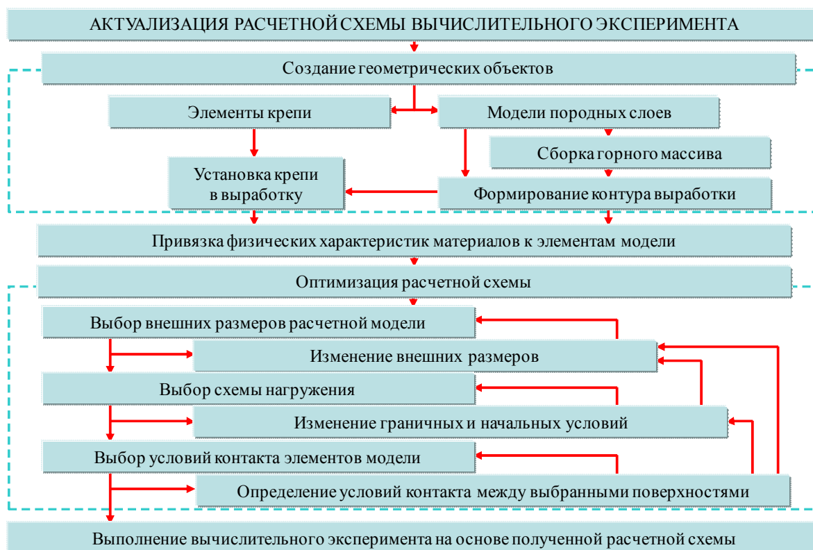
Рисунок 2. Блок-схема постановки и проведения вычислительного эксперимента

Актуализация расчетной схемы привела к созданию объемной модели, на основе которой выполнялись все последующие исследования. Для снижения влияния граничных условий на количественные результаты вычислительного эксперимента по оси выработки моделировалось шесть рам, располагающихся на расстоянии 0.5 м друг от друга. Размеры модели выбраны с учетом минимизации взаимного влияния выработки и граничных условий на результирующие эпюры напряжений и перемещений. При этом на границах модели сохраняются исходные негидростатические условия распределения вертикальных и горизонтальных компонент напряжений.