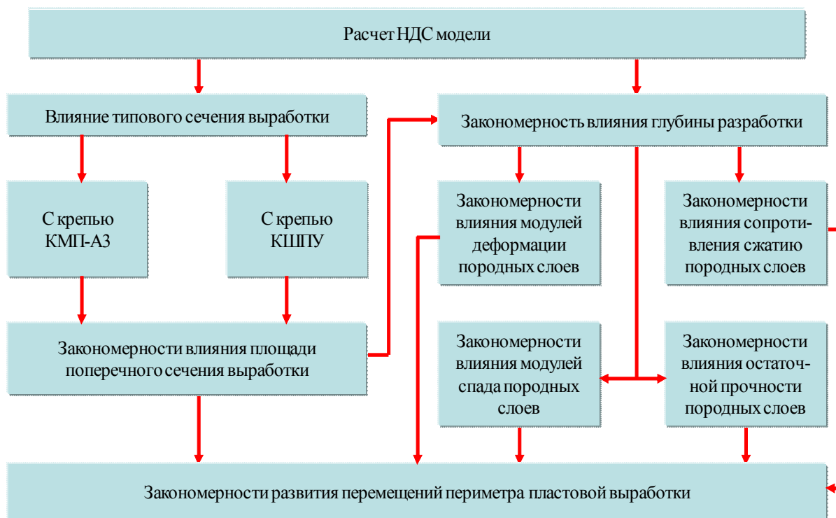
Рисунок 5. Схема проведения исследования НДС модели одного породного слоя повышенной жесткости

действия сжимающих напряжений, размеры которой определяются глубиной разработки и прочностными характеристиками близлежащих породных слоев. В рамной крепи снижение приведенных напряжений происходит в случае залегания в непосредственной кровле хотя бы одного породного слоя повышенной жесткости.