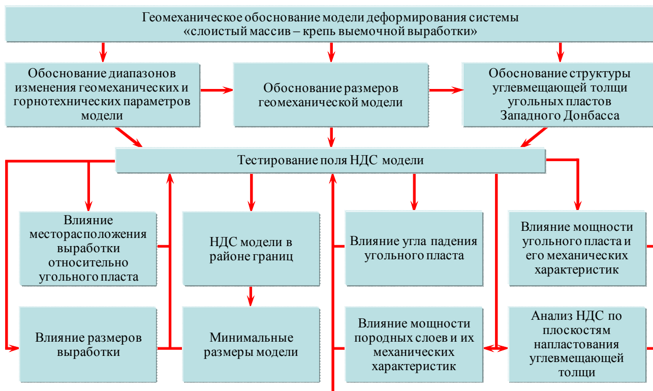
Рисунок 1. Структурная схема геомеханического обоснования модели деформирования системы “слоистый массив – крепь выработки”

На первом этапе исследований получено решение двух основных задач: выполнено геомеханическое обоснование модели сдвижения тонкослоистого массива слабых пород в окрестности пластовой выработки (Рис. 1); проведено комплексное исследование напряженно-деформированного состояния (НДС) системы “слоистый массив – крепь подготовительной выработки” по полной диаграмме деформирования каждого из составляющих ее элементов (Oparin, Akinin, Vostrikov & Yushkin, 2003).